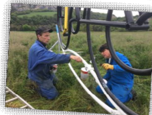
L'équipe de bénévoles lors de l'installation le 19 mai dernier.